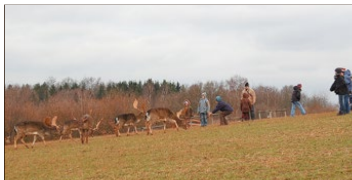
Mit etwas Glück kommt man ganz nah an das scheue Damwild heran.

Freitag, 06. Februar, 14:00-15:30 Uhr Damwildfütterung