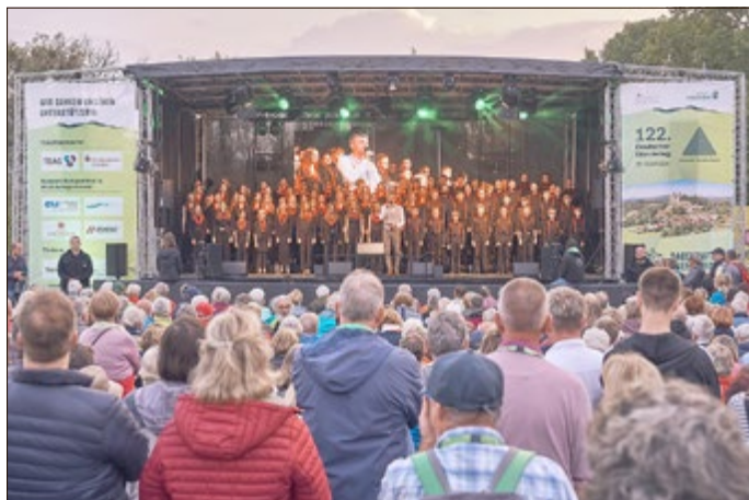
Die Eröffnung des Wandertags am 19.09.2024 auf dem Festgelände des Vitalparks.

Endlich ist es soweit: Der Video-Rückblick zum 122. Deutschen Wandertag ist fertig! Tauchen Sie noch einmal ein in die schönsten Momente, die unvergessliche Stimmung und die Highlights des großartigen Events in Heilbad Heiligenstadt und dem gesamten Eichsfeld.