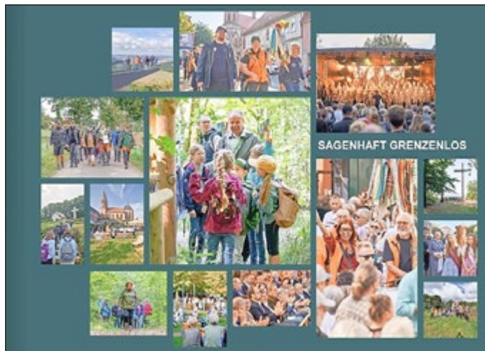
Der Bildband ist nicht käuflich erhältlich, aber kann in der Touristinfo und beim HVE angeschaut werden.

Ab sofort können Sie während der Öffnungszeiten in der Touristinformation Heilbad Heiligenstadt sowie beim HVE Eichsfeld Touristik e.V. in Leinefelde einen Bildband einsehen, der die Geschichte des 122. Deutschen Wandertags dokumentiert.