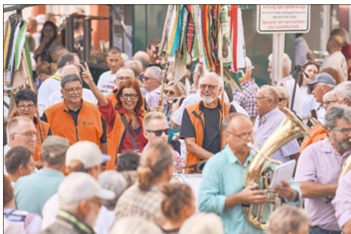
Der große Festumzug zieht am 22.09.2024 durch die Heiligenstädter Innenstadt.

Lehnen Sie sich zurück, genießen Sie die Erinnerungen - und lassen Sie sich inspirieren! Wir sagen nochmal DANKE an alle, die dabei waren und dieses Erlebnis so besonders gemacht haben.