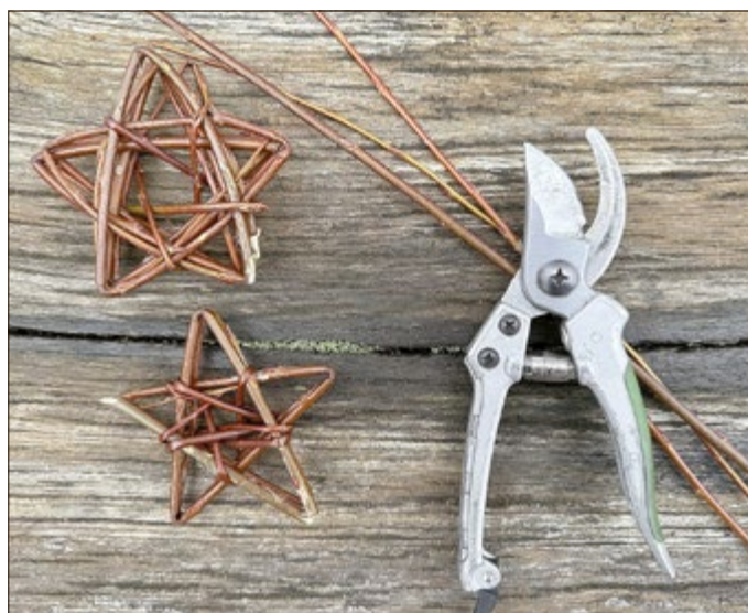
Weidenzweige eignen sich sehr gut zur Herstellung einer natürlichen Weihnachtsdekoration

Mit Weidenzweigen wird eine schöne Weihnachtsdeko hergestellt. Erwachsene 19,00 €, Kinder bis 12 Jahre 16,00 €, inkl. 4,00 € Materialkosten.