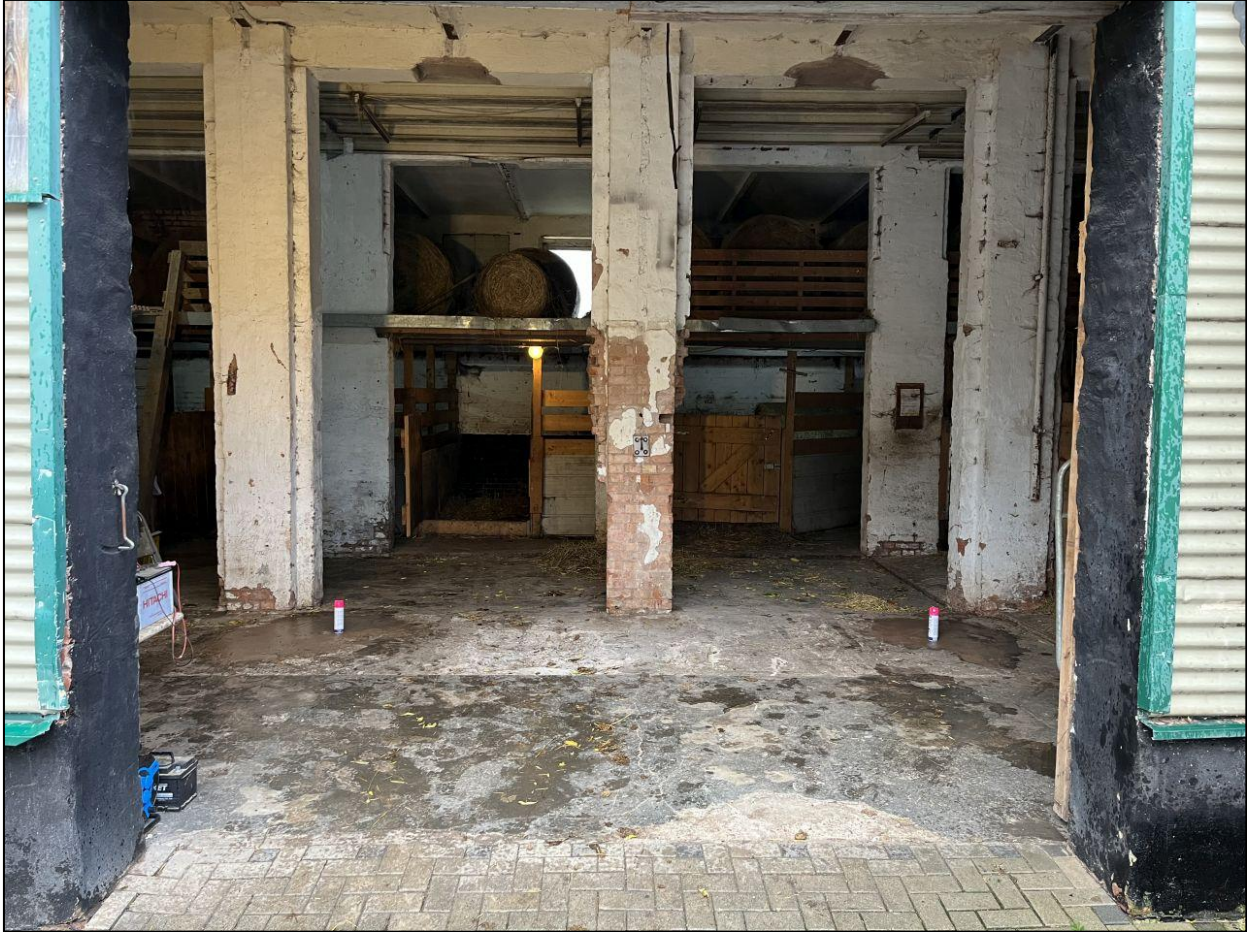
Abb. 2: Ansicht Untersuchungsbereich (links KRB 2, rechts KRB 1)

Das Bohrgut aus den Kleinrammbohrungen wurde organoleptisch begutachtet und der Schichtaufbau nach ingenieurgeologischen Kriterien in Schichtenverzeichnissen dokumentiert. Aus den Böden unterhalb der Oberflächenbefestigung wurden Bodenproben als schichtbezogene Einzelproben für chemisch-analytische Feststoff-Untersuchungen auf spezifische Verdachtsparameter (MKW, PAK 16 , PCB 6 ) entnommen (siehe Anhang – Schichtenverzeichnisse).